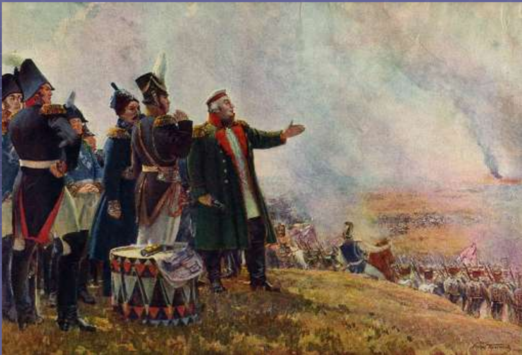
С.В. Герасимов. (род. 1885 г.) Кутузов на Бородинском поле