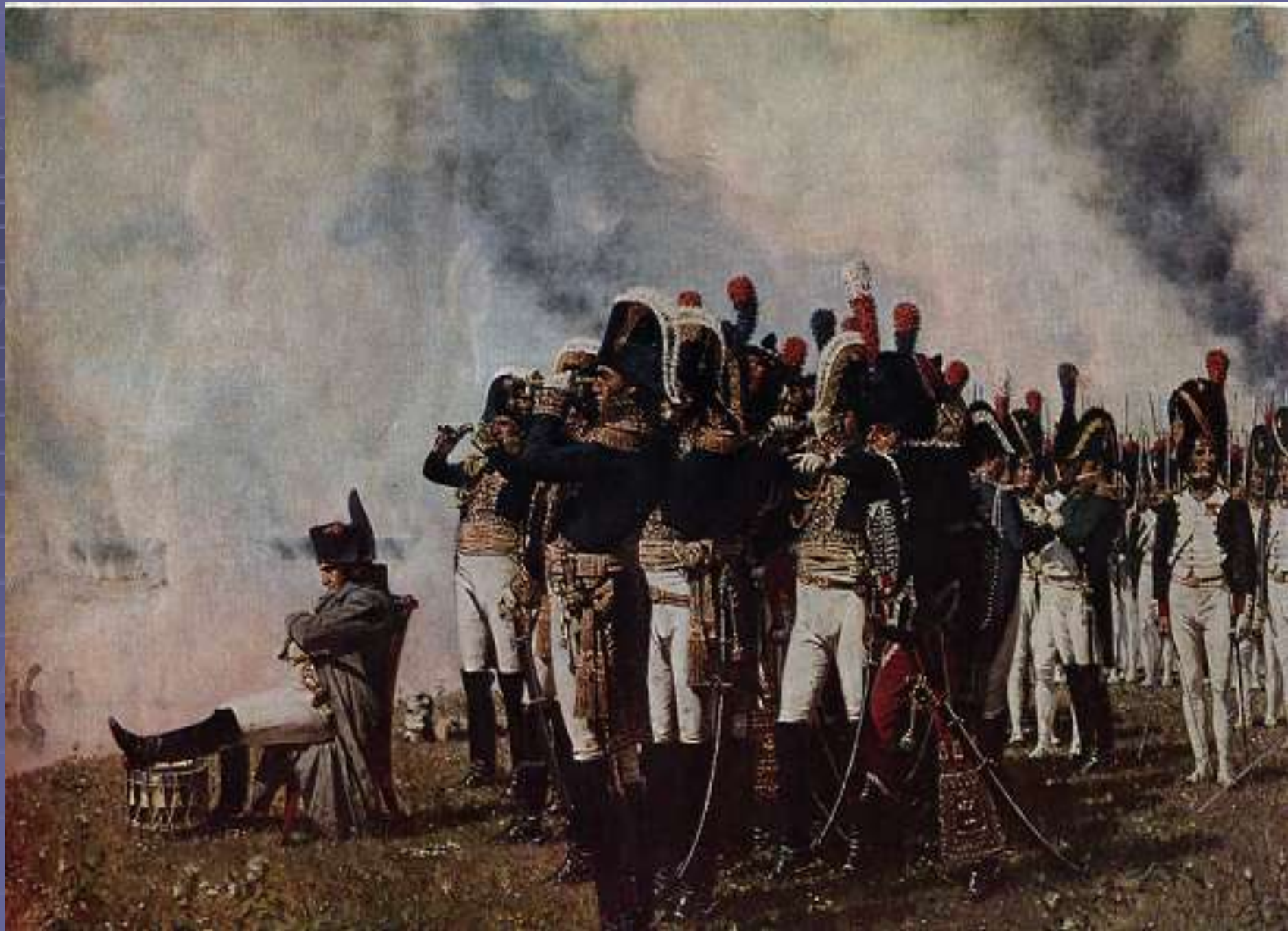
В.В. Верещагин. Наполеон I на бородинских высотах. Холст, масло.