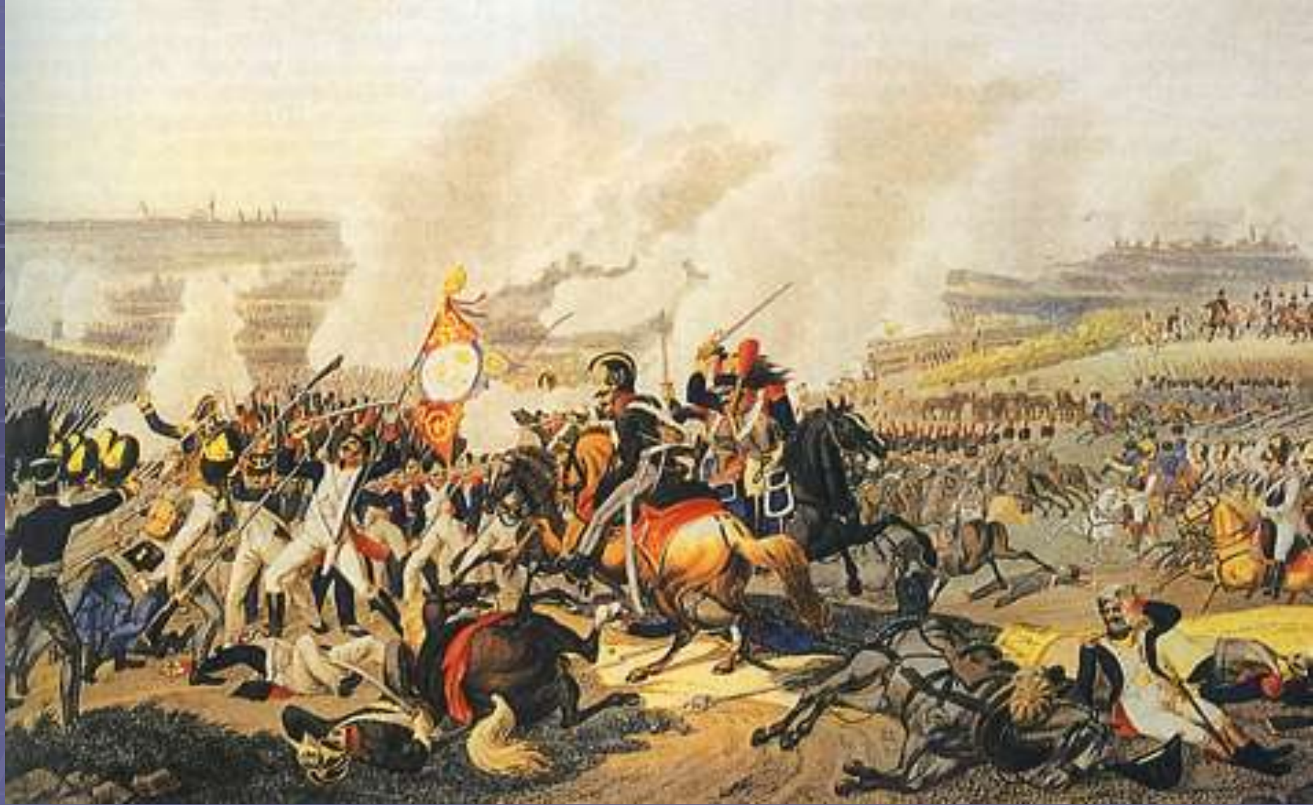
Сражение при Лейпциге 19 октября 1813 года. Раскрашенная гравюра К. Раля по оригиналу И. Клейна. 1-я четв. 19 в.