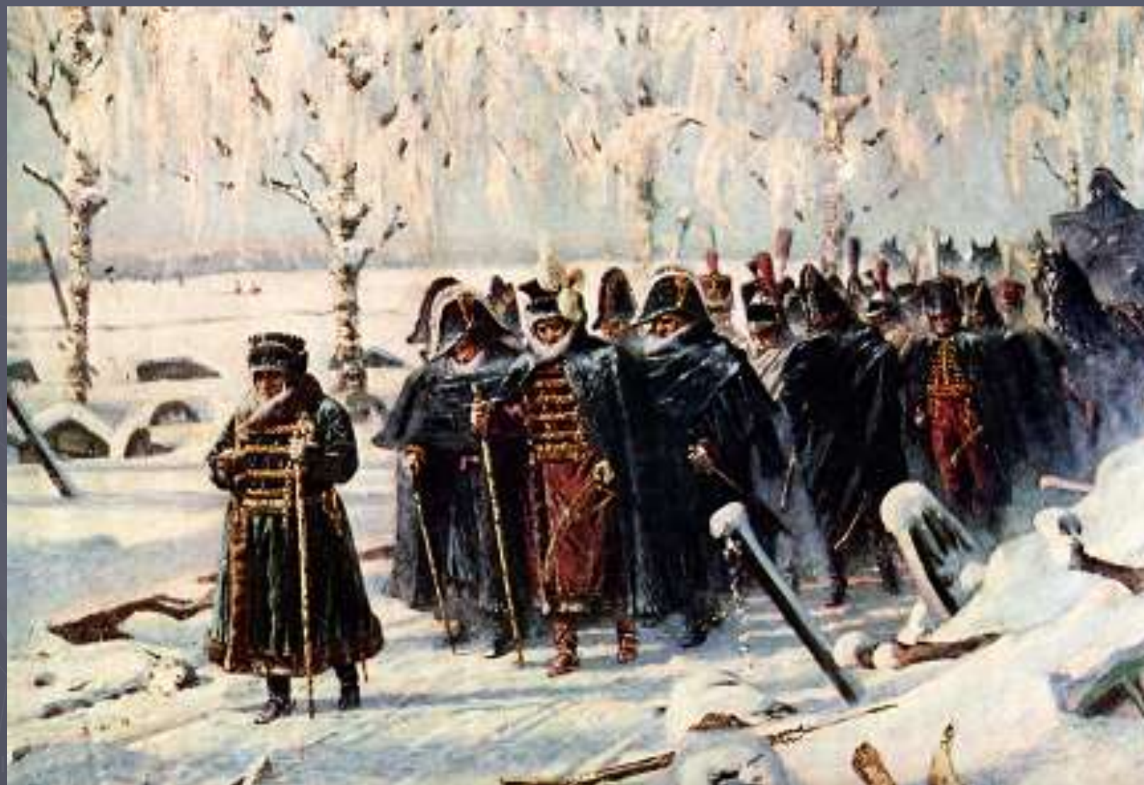
Отступление, бегство. Худ. Верещагин. 1887-1895 гг.